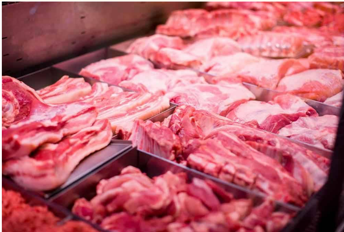
JPV menubuhkan pasukan petugas khas bagi menangani isu penjualan kambing sama ada hidup atau yang telah disembelih seperti tular baru-baru ini. (Gambar hiasan)

SHAH ALAM - Jabatan Perkhidmatan Veterinar (JPV) menubuhkan pasukan petugas khas bagi menangani isu penjualan kambing sama ada hidup atau yang telah disembelih seperti tular baru-baru ini.