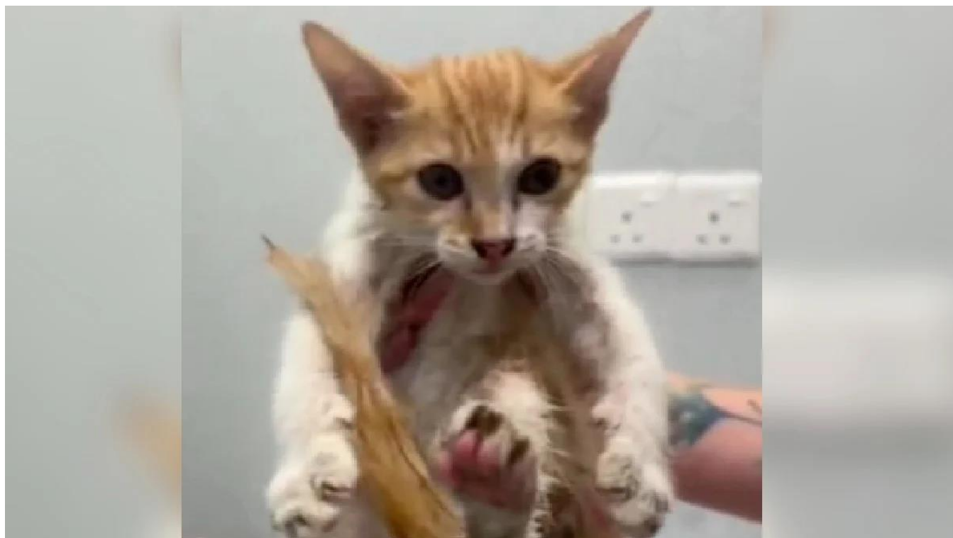
KEADAAN anak kucing yang didakwa dicampak yang akhirnya maut ditemui oleh pasangan suami isteri. Tangkap Layar video tular

Petaling Jaya: Polis mengesahkan menerima laporan berhubung tindakan seorang pengawal keselamatan yang didakwa mencampak kucing ke dalam longkang berhampiran sebuah pusat beli-belah di sini, minggu lalu.