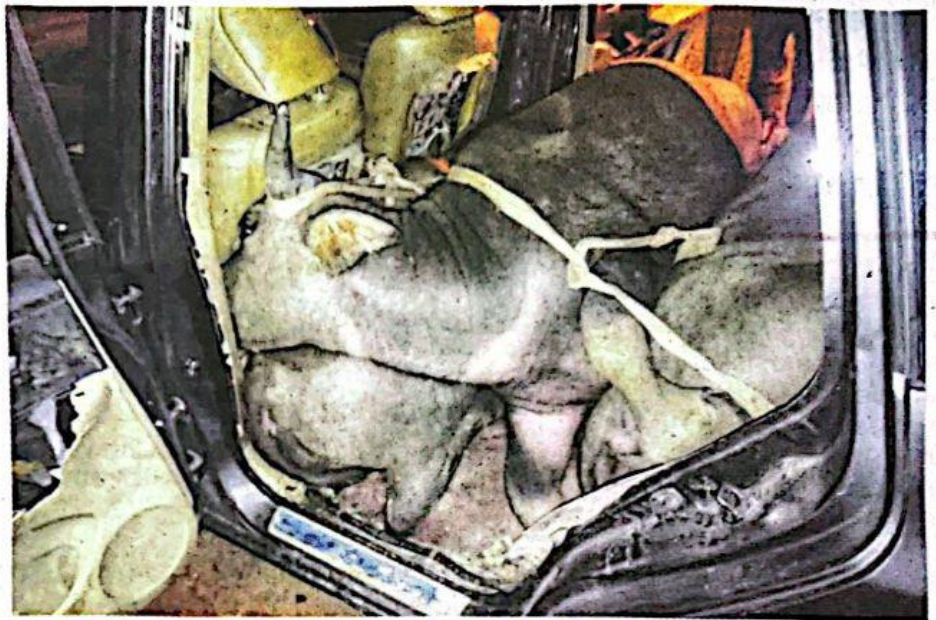
Kerbau dalam keadaan tidak bermaya dipercayai kesan ubat pelali dalam MPV.

"Siasatan awal di lokasi kejadian berjaya mengesan MPV warna kelabu dan pemeriksaan lanjut