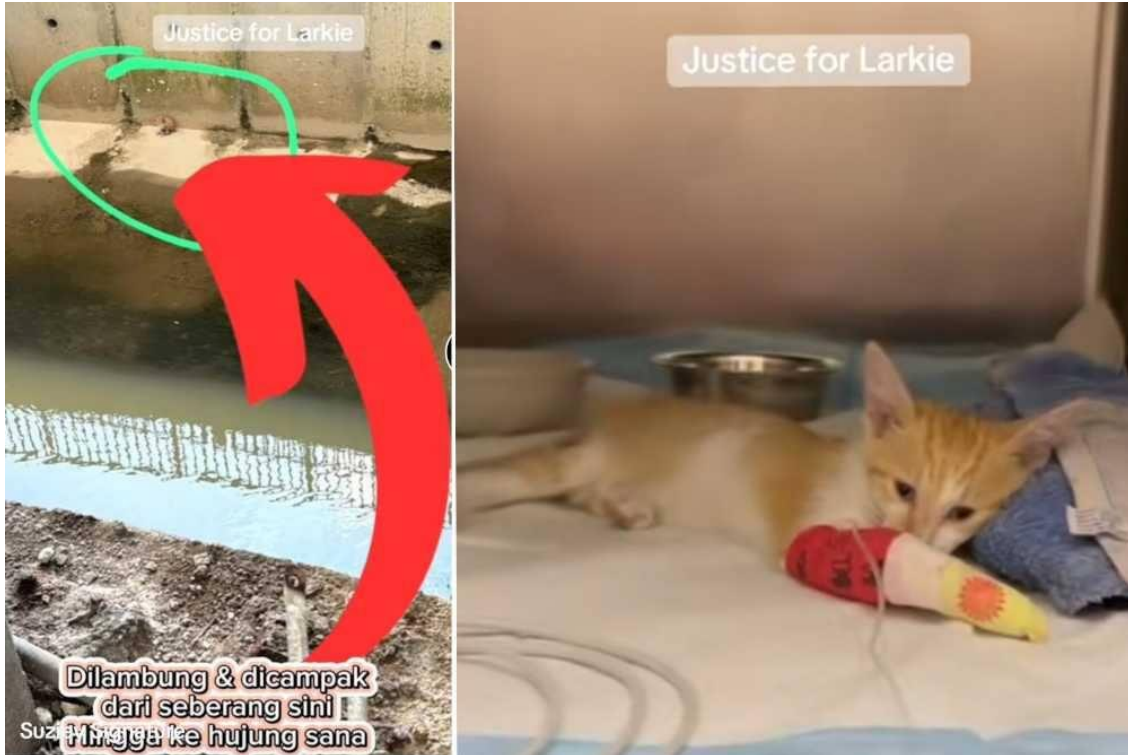
Video tular memaparkan seekor anak kucing di lempar ke dalam longkang.

PETALING JAYA - Laporan berkaitan tindakan seorang pengawal keselamatan sebuah pusat beli-belah di sini yang melempar anak kucing ke dalam longkang telah dirujuk ke Jabatan Veterinar untuk tindakan lanjut.