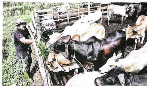
Aiman Asyraf memberi makanan berkualiti kepada lembu ternakan di ladangnya bagi menghasilkan daging yang bermutu.

"Saya lihat usaha ini berbaloi dan kini memiliki lapan ekor lembu 'sado' daripada baka Charolais dan Limousine serta 35 ekor lembu baka Brahman yang menjadi sumber reze-