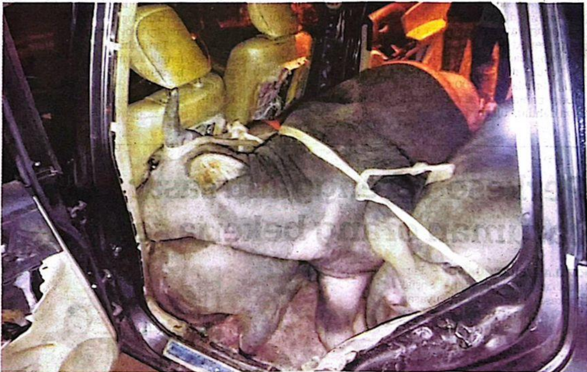
KERBAU yang diletakkan dalam keadaan berhimpit ditinggalkan di dalam sebuah kenderaan yang mengalami kerosakan di Kampung Kuala Bera, Bera semalam.

Katanya, siasatan giat dilakukan termasuk mengesan suspek terlibat dan maklumat kenderaan yang digunakan.