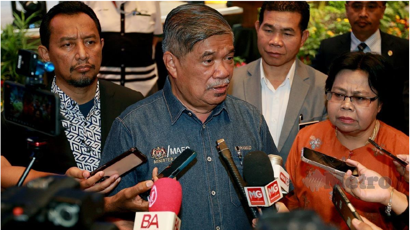
Menteri Pertanian dan Keterjaminan Makanan, Datuk Seri Mohamad Sabu (dua dari kiri) pada sidang media selepas Perasmian Simposium Pengembangan Jabatan Pertanian 2024 di Hotel KSL Esplanade, Klang.

Klang: Kementerian Pertanian dan Keterjaminan Makanan (KPKM) mahu sempadan negara dipertingkatkan penguatkuasaan bagi mengekang penyeludupan masuk kambing dan lembu terutamanya menjelang Hari Raya Aidiladha.