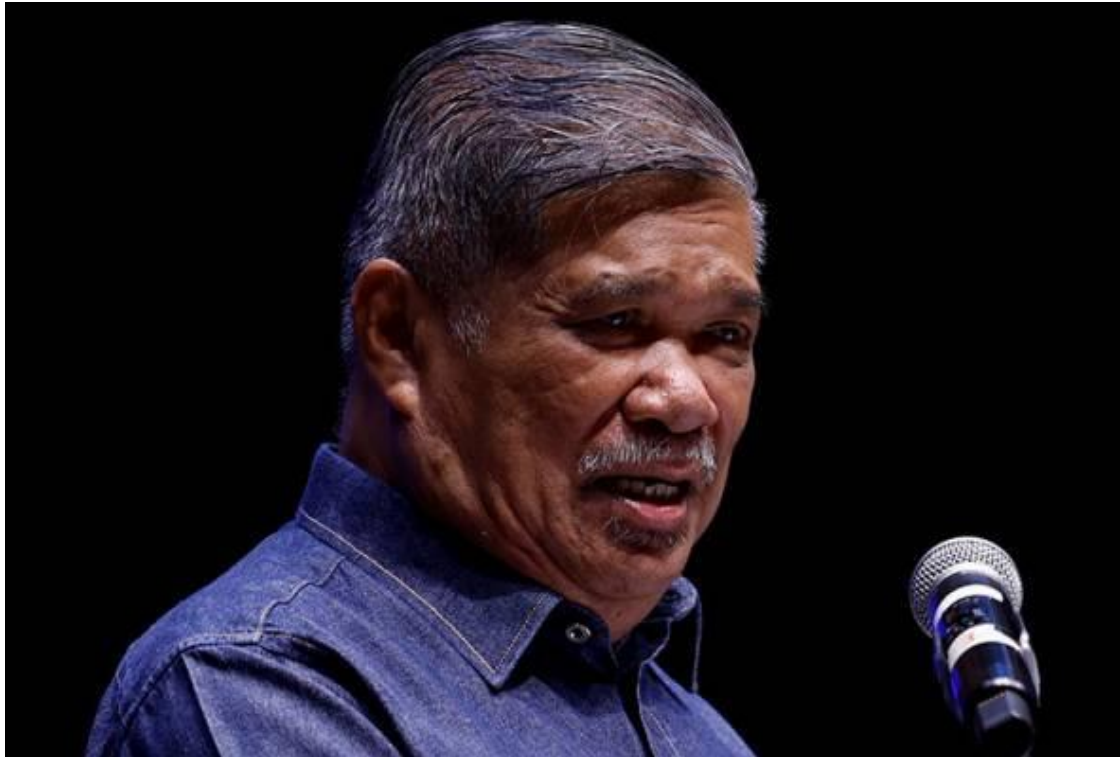
Mohamad Sabu berucap merasmikan majlis Perasmian Simposium Pengembangan Subsektor Tanaman Jabatan Pertanian Tahun 2024, hari ini.

KLANG: Kementerian Pertanian dan Keterjaminan Makanan (KPKM) meminta jabatan dan agensi kerajaan berkaitan kawalan sempadan memperhebat penguatkuasaan serta kawalan di pintu masuk negara bagi menangani kemasukan kambing dan lembu murah serta diragui status kesihatannya menjelang Aidiladha akan datang.