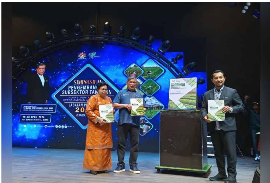
Mohamad (tengah) ketika merasmikan Majlis Simposium Pengembangan Subsektor Tanaman Jabatan Pertanian Tahun 2024 di KSL Esplanade Hotel, Klang pada Isnin.

KLANG - Menteri Pertanian dan Keterjaminan Makanan, Datuk Seri Mohamad Sabu meminta agar penguatkuasaan di sempadan negara dipertingkatkan bagi mengekang penyeludupan kambing dan lembu murah.