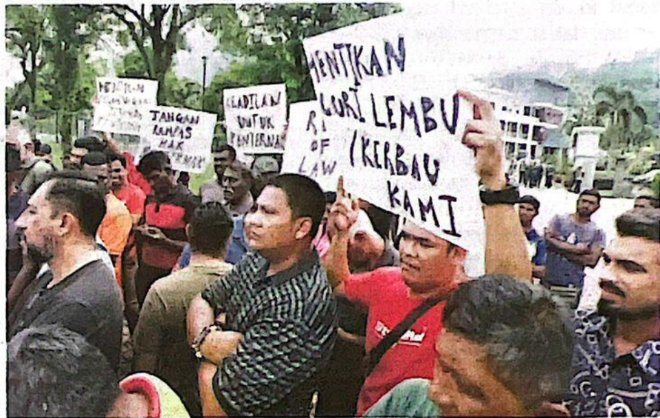
Sekumpulan penternak menyertai perhimpunan aman di hadapan MDKpr pada Isnin.

KAMPAR - Beberapa penternak mempersoal prosedur operasi tangkapan selepas mendakwa haiwan ternakan mereka yang berada di kandang dan kawasan persendirian disita pihak berkuasa tempatan (PBT).