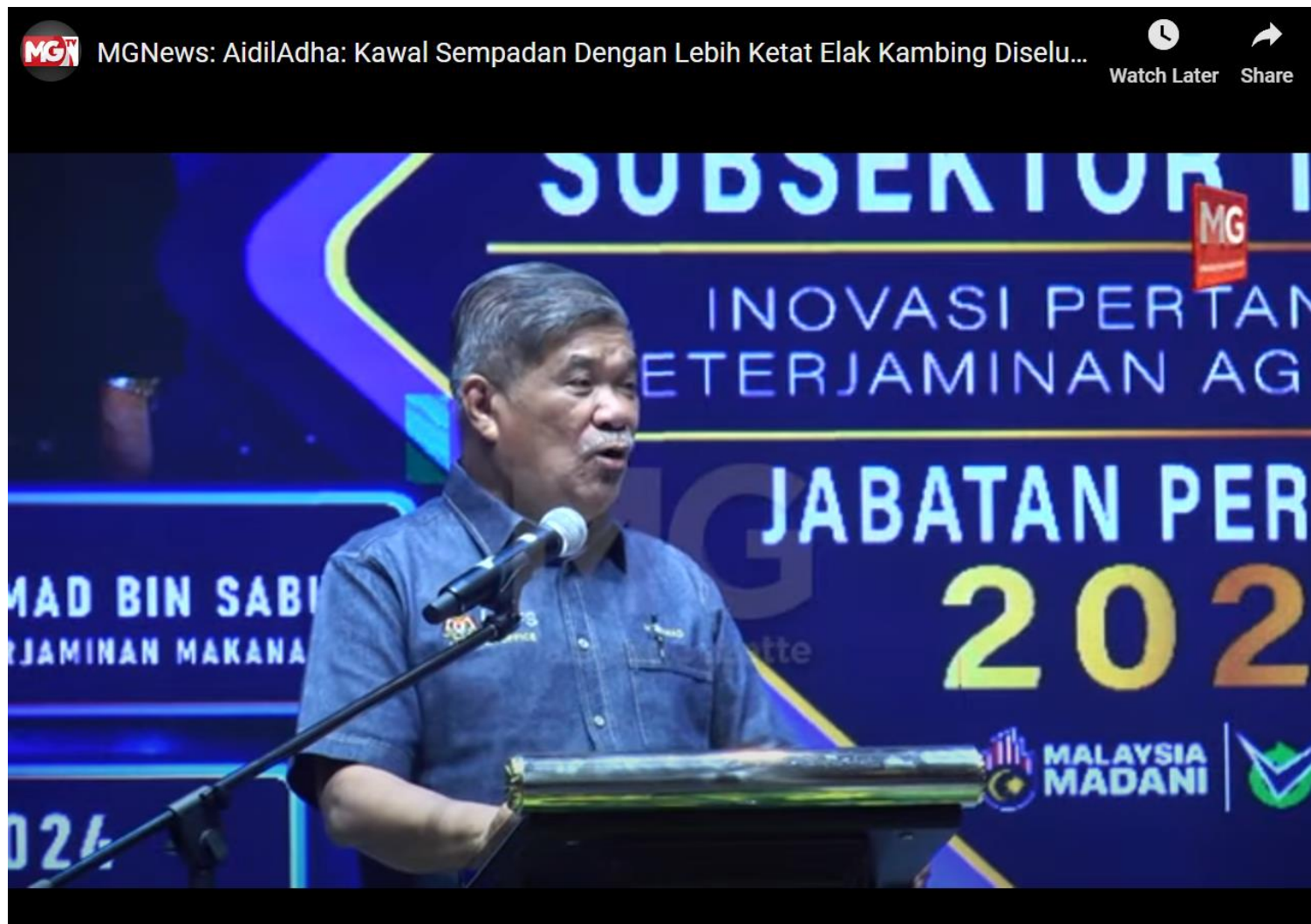
Menteri Pertanian dan Keterjaminan Makanan, Datuk Seri Mohamad Sabu berkata langkah itu bagi mengelak masalah kerana harga kambing import jauh lebih murah.