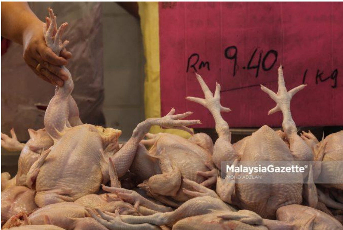
Harga ayam segar yang dijual sekilogram RM9.40 selepas kerajaan mengumumkan penamatan sepenuhnya pemberian subsidi dan harga kawalan bagi ayam bermula berkuat kuasa hari ini ketika di Pasar Moden Seri Muda, Shah Alam. 01 NOVEMBER 2023.

KUALA LUMPUR – Harga dan bekalan ayam di negara ini kini stabil, kata Menteri Pertanian dan Keterjaminan Makanan, Datuk Seri Mohamad Sabu.